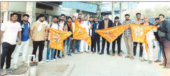
बैकुण्ठपुर रोड रेलवे स्टेशन से होते दिनां दिल्ली के लिए ट्रेन से रवाना हुए, सभी गौ सेवक पंडित धीरेन्द्र शास्त्री के पदयात्रा में शामिल होंगे।

बैकुण्ठपुर। बाणेश्वर धाम प्रमुख पंडित धीरेन्द्र शास्त्री द्वारा भारत को हिन्दू राष्ट्र बनाने, गौ माता को राष्ट्र माता का दर्जा देने सहित अन्य संकल्पों को लेकर दिल्ली से वृन्दावन तक की पदयात्रा शुरू की गई। इसमें कोरिया जिले के भी काफी संख्या में गौरक्षा सेवा के पदाधिकारी एवं सनातन ऐरमी उक्त यात्रा में शामिल होने के लिए दिल्ली रवाना हुए।