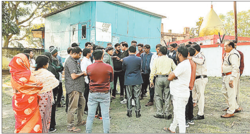
परिजन को समझाई देती पुलिस।