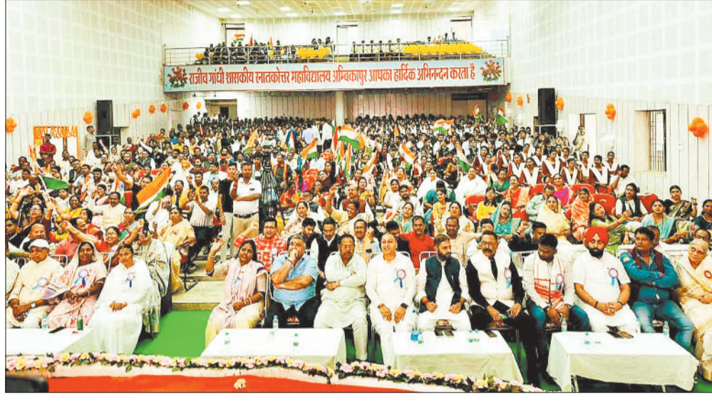
वंदे मातरम कार्यक्रम में शामिल अतिथिगण व अन्य।