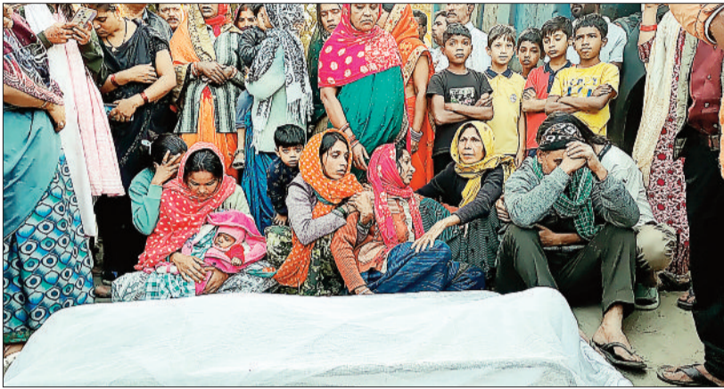
सड़क पर शव रखकर विरोध प्रदर्शन करते परिजन।